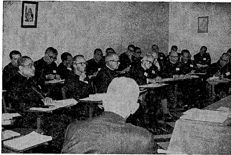
Sala plenaria en la XI Reunión