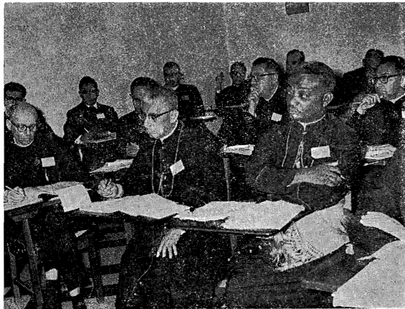
Comisiones de trabajo

"Cabe destacar, en el informe presentado por Mons. Avelar Brandao, cómo la Conferencia Episcopal del Brasil ha venido asumiendo los Documentos publicados por el CELAM para hacerles base efectiva de su Pastoral de Conjunto y con relación a las diversas áreas, habiéndose preparado ya la edición portuguesa de los Documentos originalmente publicados en Español" (Actas de la XI Reunión Anual del Consejo Episcopal Latinoamericano).