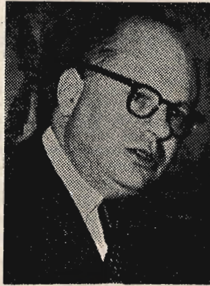
ESTUDIAR LA REALIDAD...