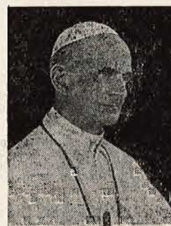
...El hombre: un ciudadano del mundo...

Nos dirigimos a vosotros, hermanos amadísimos, en la proximidad del "Día mundial de los medios de Comunicación Social..."