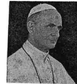
S. S. PAULO VI: No más analfabetismo religioso...

Los sacerdotes están siempre dentro de nuestro espíritu, en nuestro recuerdo. Lo están también en nuestra estima y en nuestra confianza. Lo están en la visión concreta de la actividad de la Iglesia: son vuestros primeros e indispensables colaboradores, son los más directos y más empeñados "dispensadores de los misterios de Dios", es decir, de la palabra, de la gracia, de la caridad pastoral; son los modelos vivientes de la Imitación de Cristo; son, con nosotros los primeros participantes del sacrificio del Señor; son nuestros hermanos, nuestros amigos; debemos amarlos mucho, cada vez más. Si un Obispo concentrase sus cuidados más asiduos, más inteligentes, más pacientes, más cordiales, en formar, en asistir, en escuchar, en guiar, en instruir, en amonestar, en confortar a su Clero habría empleado bien su tiempo, su corazón y su actividad.