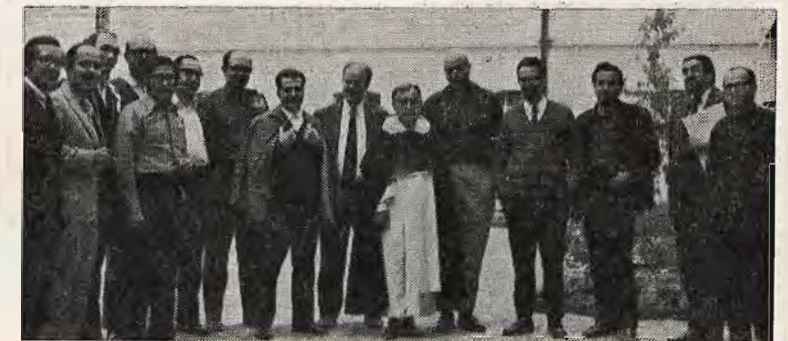
La fotografía muestra a varios de los participantes, procedentes de diversos países latinoamericanos, quienes asistieron al Primer Encuentro de la Comisión de Estudios de Historia Religiosa Latinoamericana.

Enero de 1976: Entrega de originales para la impresión.