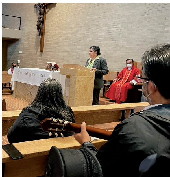
Los participantes del encuentro, durante una celebración

Al final del encuentro se suscribió una carta de intención, cada uno desde su opción y trabajo particular se comprometió a ofrecer desde la acción una →